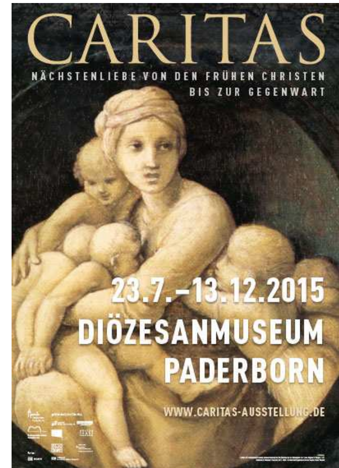
Caritas - Plakatmotiv (Diözesanmuseum Paderborn)