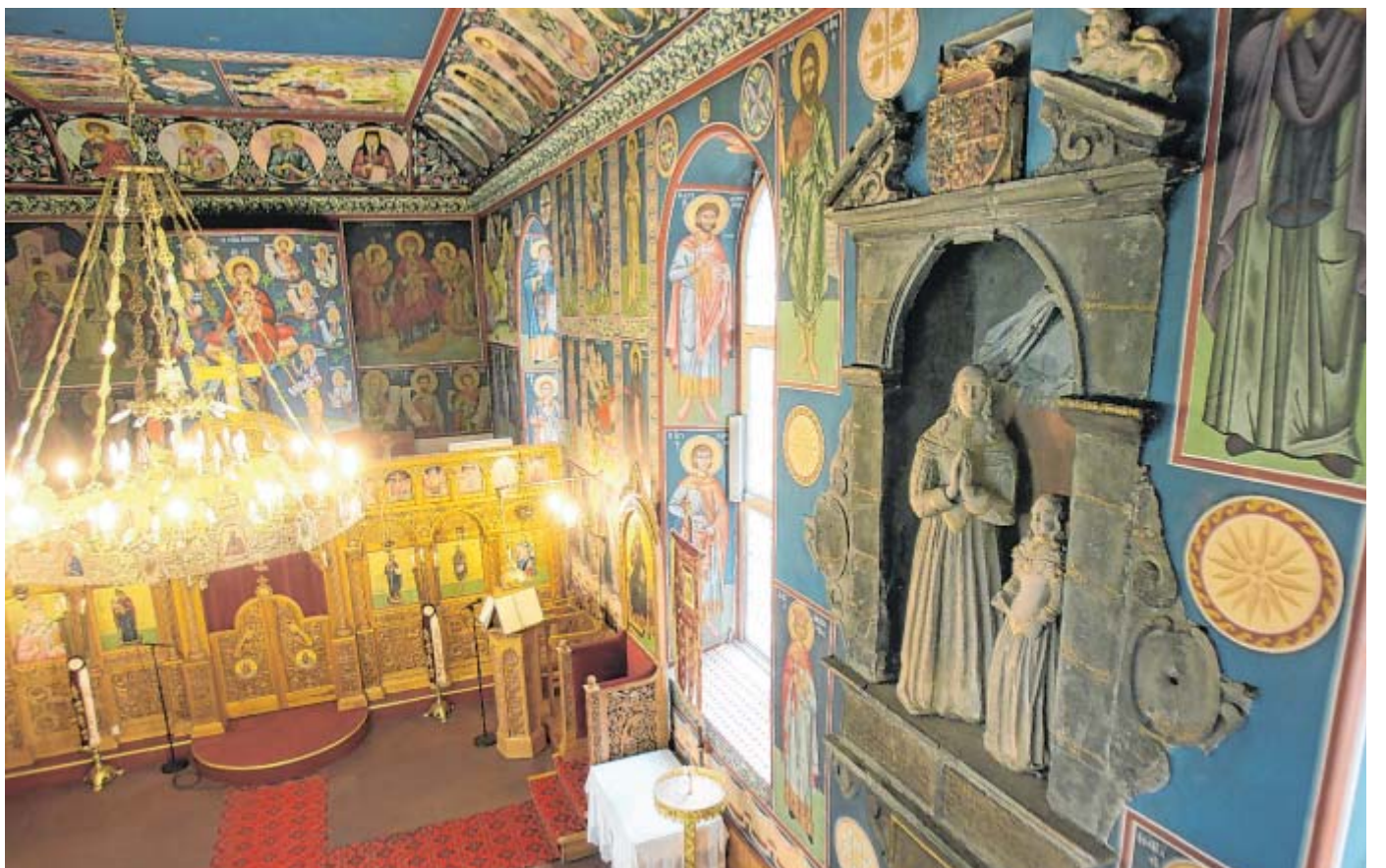
Wolderuskapelle: Die Keimzelle des von Waltger gegründeten Stiftes ist nur selten zugänglich. Es ist seit Jahrzehnten das Gotteshaus der griechisch-orthodoxen Kirche. Am Stiftstag gab es Führungen. Im Mediaguide zum Damenstift gibt es Fotos aus älteren Tagen.