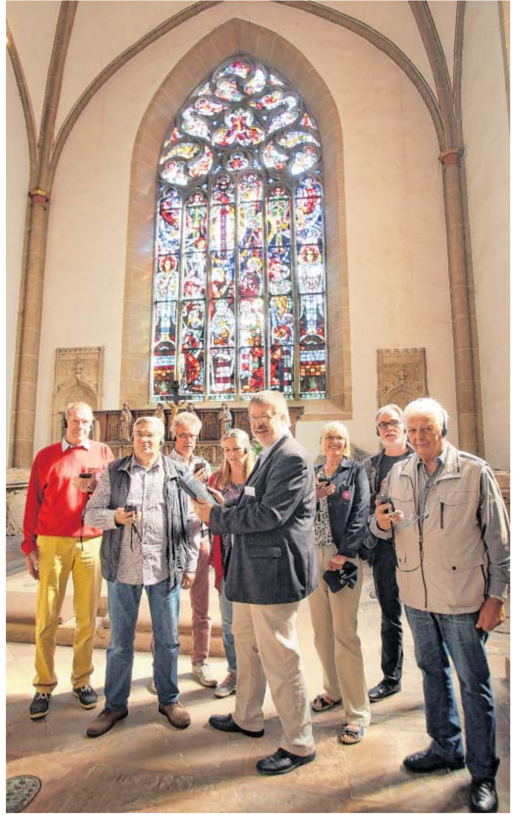
App Damenstift: Am Stiftstag konnten die ersten Besucher den neuen Multimedia-Guide mit Gerät ausleihen. Er funktioniert auch als App auf dem eigenen Smartphone.