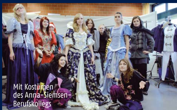
Mit Kostümen des Anna-Siemsen- Berufskollegs

Nach der Vorführung besteht die Möglichkeit zur Diskussion!