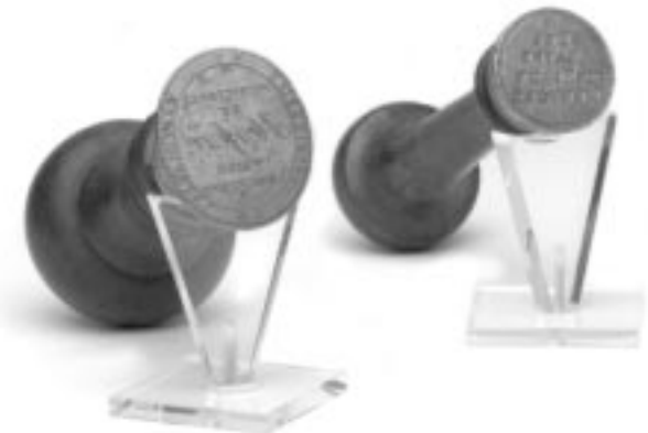
| 9.3 | →