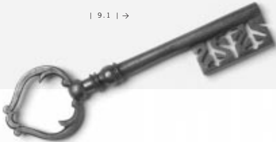
| 9.1 | →