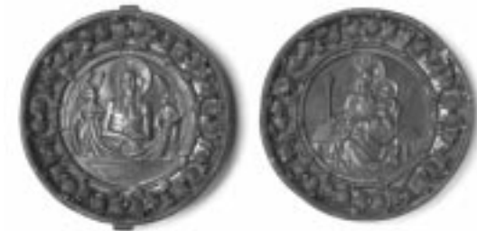
| 1.3 | →

Die reich geschmückte silberne Reliquienkapsel gehörte ebenfalls zum berühmten Dionysiussschatz des Stiftes St. Johannes und Dionysius. Die Vorder- und Rückseite der Kapsel sind aus unbekanntem Gründen getrennt worden. Beide Teile enthalten ein flaches vergoldetes Relief, das sich vor blauen Email wirkungsvoll abhebt. Dargestellt sind eine Engelpieta mit Christus als Schmerzensmann, umgeben von zwei Engeln und auf der Rückseite eine thronende Maria mit Christuskind als Himmelskönigin. Die seltene Arbeit nach italienischem Vorbild stammt aus dem norddeutschen Raum. Hier ebenso eine Nachbildung des Originals. Leihgabe aus der stadtgeschichtlichen Sammlung im Daniel-Pöppelmann-Haus Herford