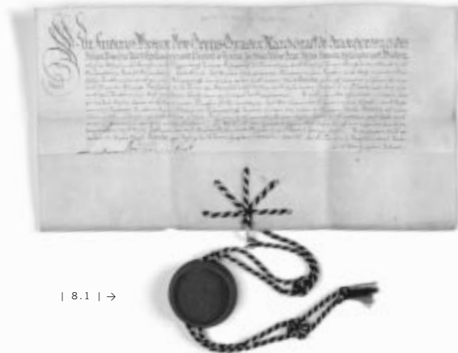
| 8.1 | →