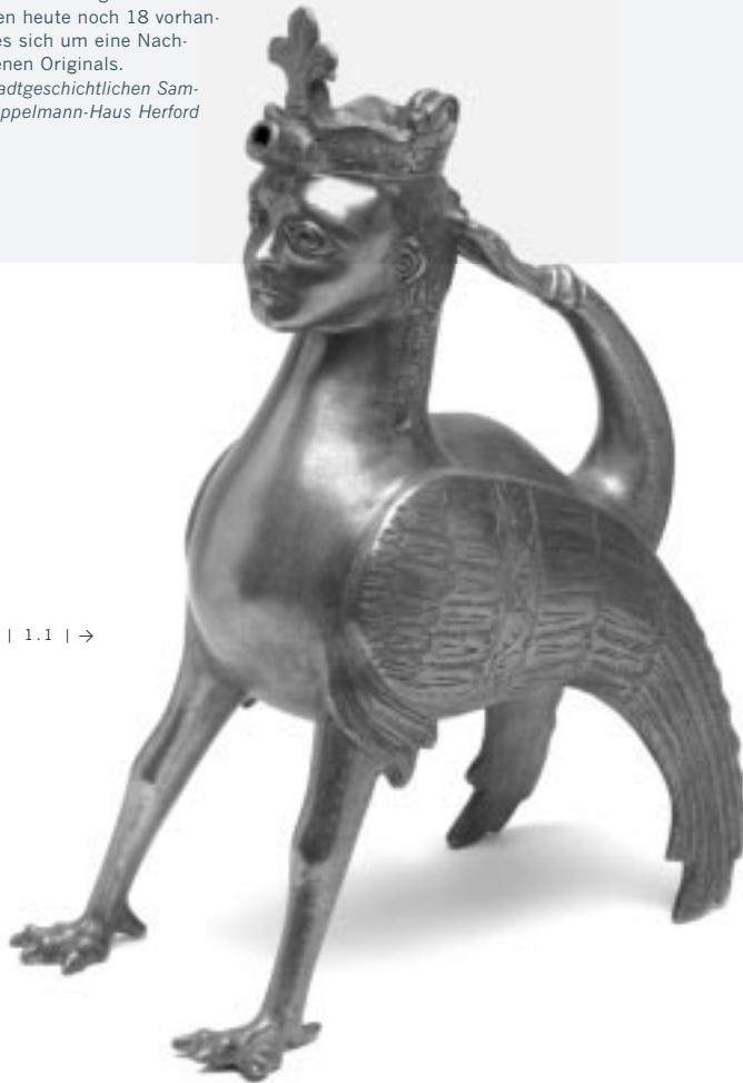
| 1.1 | →

Dieses Gießgefäß in ungewöhnlicher Form eines antiken Fabelwesens ist eines der erst-rangigsten Werke des mittelalterlichen Bronzegusses und das einzige erhaltene Exemplar dieses Typus. Die hoheitsvolle Gestalt einer Sirene, halb Vogel, halb Mensch, wird durch den strenge geradeaus gerichteten Kopf und die Lilienkrone über der Ausgussöffnung auf der Stirn betont. Es diente zur Handwaschung im Stift St. Johannes und Dionysius und stammt aus dem kunsthistorisch wertvollen Dionysiussschatz, der sich seit dem 10. Jahrhundert in Enger und seit 1414 in der Neustädter St. Johanniskirche befand. Durch die Säkularisierung in staatlichem Besitz gekommen, wurde der Schatz 1885 in das Kunstgewerbemuseum Berlin (Staatliche Museen Preußischer Kulturbesitz) überführt und ist dort teilweise an prominenter Stelle ausgestellt. Von den ehemals 32 Gegenständen sind nach Kriegsverlusten heute noch 18 vorhanden. Hier handelt es sich um eine Nachbildung des bronzenen Originals. Leihgabe aus der stadtgeschichtlichen Sammlung im Daniel-Pöppelmann-Haus Herford