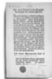
← | 9.5 |