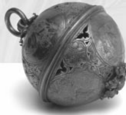
← | 1.2 |

Ein Bestandteil des Dionysiussschatzes ist auch der zweiteilige, aus Silberblech getriebene Duftapfel. Die figürlichen Darstellungen zeigen die hl. Veronika, Christus als Schmerzensmann, Maria mit dem Kind und eine Marienklage. Solche «Kugeln eines Chormantels» wurden mit kostbaren Riechstoffen zum Schutz vor Pest und ansteckenden Krankheiten gefüllt und von den Kanonikern des Stifts am Gürtel getragen. Auch hier die Nachbildung des Originals. Leihgabe aus der stadtgeschichtlichen Sammlung im Daniel-Pöppelmann-Haus Herford