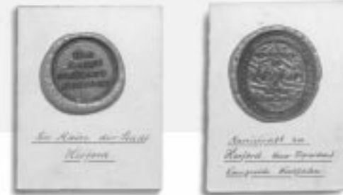
← | 9.4 |